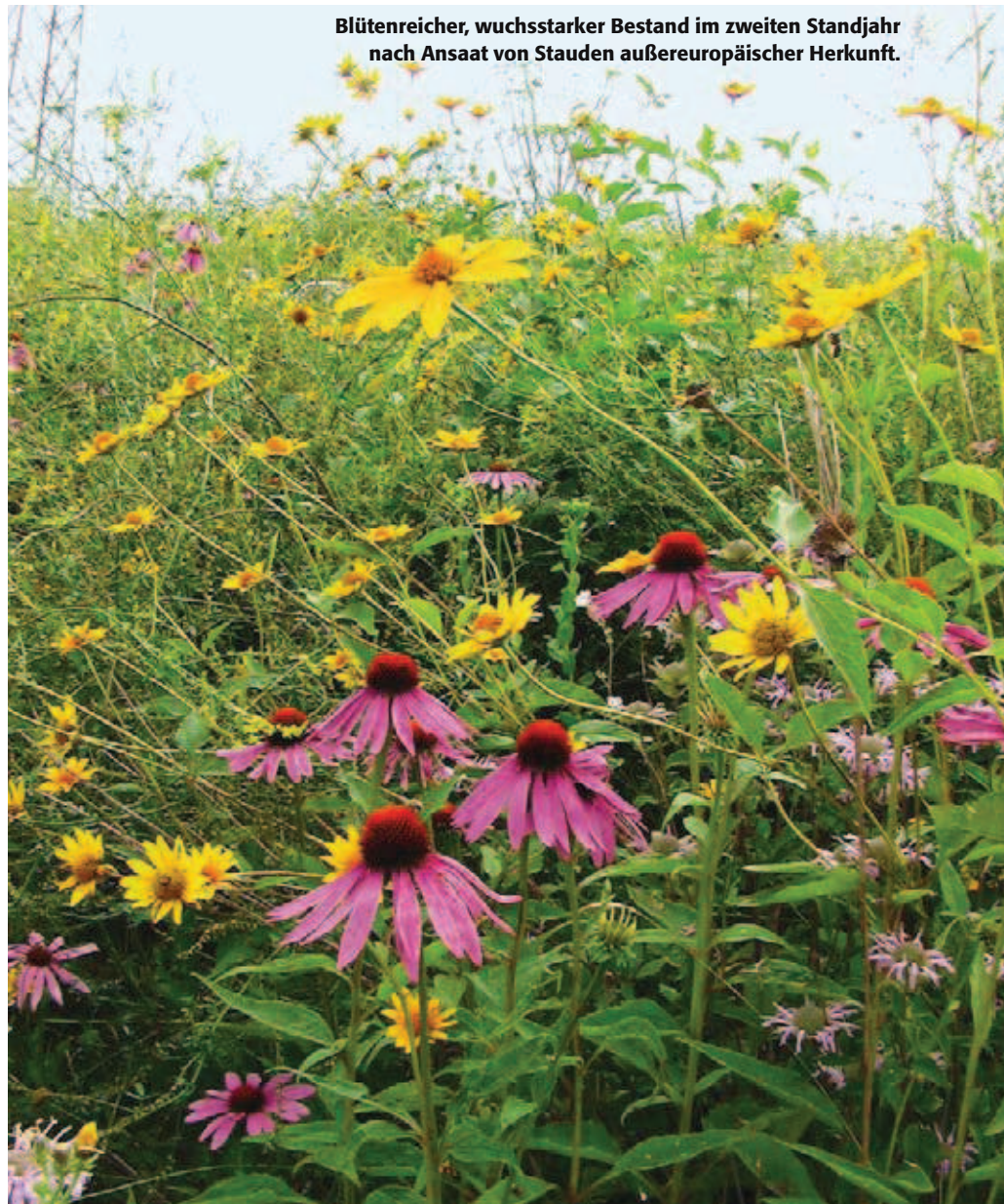
Blütenreicher, wuchsstarker Bestand im zweiten Standjahr nach Ansaat von Stauden außereuropäischer Herkunft.

Bei den ökologischen Mischungen wurden ab Juli geeignete Trockensubstanzgehalte des Pflanzenmaterials erreicht. Erste Probeernten dieser Mischungen ergaben gegenüber dem Vorjahr leicht gesteigerte Ertragswerte. Die Methanausbeute des zweiten Standjahrs liegt noch nicht vor. Untersuchungen an älteren Ansaat- oder Pflanzparzellen zeigen jedoch, dass die Methanausbeute einiger in den Mischungen