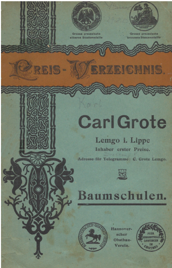
Katlaog 01 ca. 1910